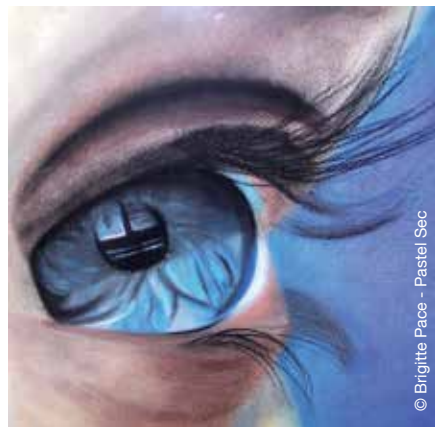
© Brigitte Pace - Pastel Sec